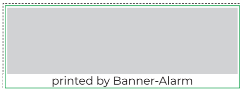
1:1 Vorlage auf Seite 2