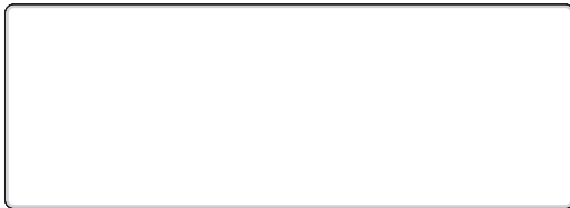
1:4 Vorlage auf Seite 2 und 3